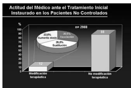
Figura 2. Hipertensión.

en los varones la 2ª causa de muerte (34´1%) después de los tumores y en las mujeres la primera (39´5%). La mortalidad por enfermedad cardiovascular sigue una tendencia descendente en la CAPV, lo mismo que en los países occidentales. Esto se ha relacionado con un mejor diagnóstico y tratamiento de la HTA. Por ello se ha confeccionado una Guía de Práctica Clínica sobre HTA donde se dan respuesta a muchas preguntas sobre objetivos de cifras de TA, diagnóstico, tratamiento en pacientes con y sin enfermedad asociada como ictus, nefropatía diabética, cardiopatía isquémica, asma, broncopatía crónica,