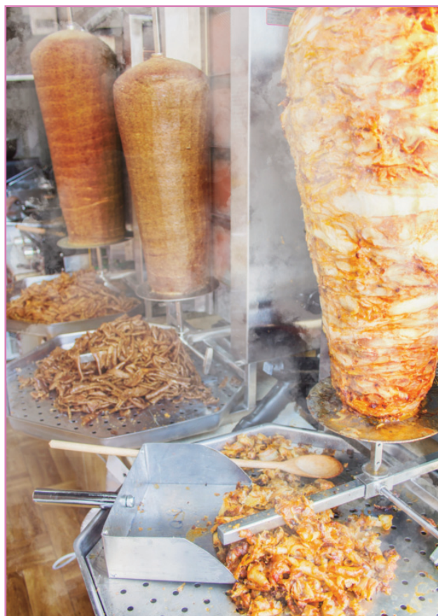
Figura 1. Imagen de la preparación del kebab en un establecimiento döner kebabs y su producto final para consumo.

La normativa europea prohibió el uso del aditivo E 338-452 (fosfatos) en una serie de alimentos en 2008 por los posibles riesgos para la salud que podría conllevar. En concreto, cuando el Parlamento Europeo aclaró lo que estaba ocurriendo tras el revuelo de una serie de noticias, avisó de que entre las enfermedades que hasta ahora se ha asegurado que puede provocar el uso de fosfatos como aditivo están las cardiovasculares 3-5 .