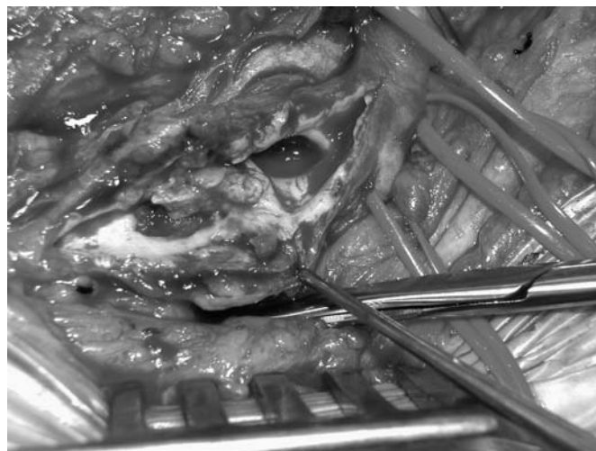
Figura 4: Pseudoaneurisma de aproximadamente 4 cm distal al origen de la arteria femoral superficial con magma fibrosos perianeurismático sin colecciones alrededor y con trombo en su interior.

La incidencia de pseudoaneurismas iatrogénicos en pacientes que han sido sometidos a cateterizaciones previas es de aproximadamente 0,2% (1). Los factores de riesgo para desarrollar pseudoaneurismas iatrogénicos depende tanto del procedimiento (catéteres de gran calibre, procedimientos terapéuticos vs. diagnósticos, realización de múltiples punciones, uso de múltiples catéteres, procedimientos de larga duración, poca experiencia del médico, uso de agentes trombolíticos) como del paciente ( sexo femenino, edades