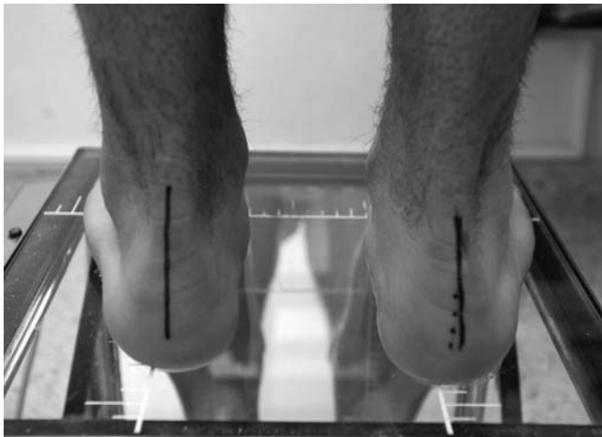
Figura 2. Detalle de una de las exploraciones clínicas realizadas

mente normal en la edad adulta (10), aunque otros autores defiendan incluso el tratamiento quirúrgico en esta situación, con la argumentación de que no es posible predecir qué pies serán dolorosos en la vida adulta. Este último extremo es discutido en algunos artículos (11,12,13) en los que se establece que existe una proporción muy baja de evolución a pies planos en el adulto y que además, raramente son dolorosos.