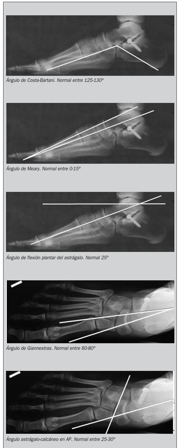
Figura 1. Esquema de las mediciones radiológicas

Parece que existe cierto acuerdo en la actualidad en no tratar un pie plano flexible asintomático, ya que tras el crecimiento existe un 95% de probabilidades de que el pie sea funcional-