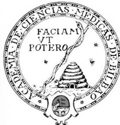
Figura 1 Escudo de la Academia de Ciencias Médicas de Bilbao.

La Fundación de Estudios Sanitarios que la Academia comparte con el Colegio Oficial de Médicos de Bizkaia es, a su vez, un exponente de formación continua acreditada con más relevancia y calidad en los que participa la Academia.